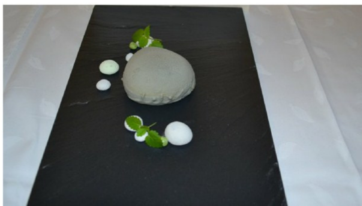
Sladica Grahnit - z graham, v podobi granita